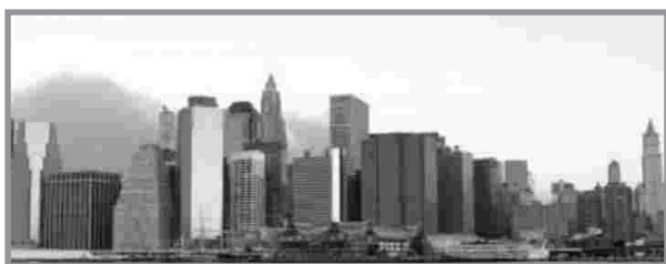
Septiembre 12, 2001