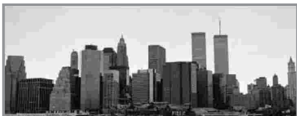
Agosto 14, 2000